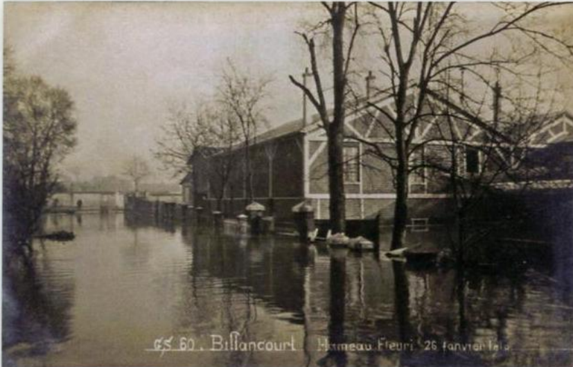
65 60. Billancourt Hameau Fleuri 26 janvier 1910

8 Au verso, un commentaire : « Vue de leur vue (sic !) prise à l'opposé de la Seine, à Billancourt à l'endroit où on pouvait prendre le bateau pour venir à l'usine qui se trouve à l'autre extrémité de la rue sur la Seine mais que l'on ne voit pas sur la vue ».