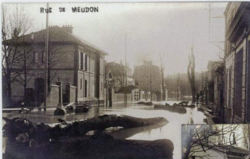
5 Photographe non-identifié, rue de Meudon.

L'entreprise automobile Renault Frères a été fondée le 25 février 1899 par Marcel et Fernand Renault, au 10 rue du Cours à Billancourt (aujourd'hui avenue Émile Zola). Le premier véhicule de la marque est sorti de leur usine en 1899.