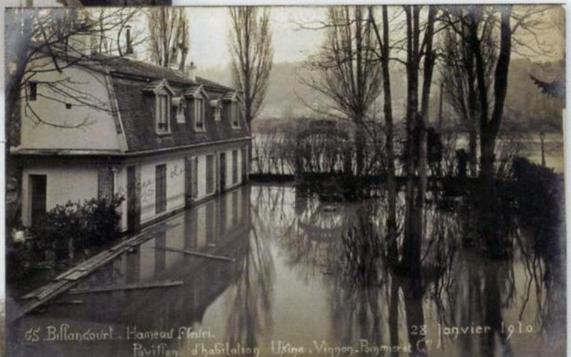
6 Carte issue d'une série de cinq cartes-photos, témoignage sur le Hameau fleuri dû à G. Simard, photographe à Sèvres, identifié par le sigle G. S. Commentaire : « Le pavillon de Pommier et le jardin complètement inondé. »