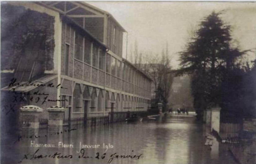
Hameau Fleuri Janvier 1910

9 Au verso, un commentaire : « Départ de tous les ouvriers le 26 janvier. Pommier et Vignon dans l'échelle remontant au premier »