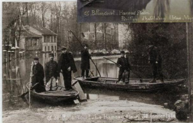
7 Au verso de cette carte sur le Hameau fleuri, un commentaire : « Pommier sur le bateau allant à l'usine dont on aperçoit la cheminée à travers les arbres »