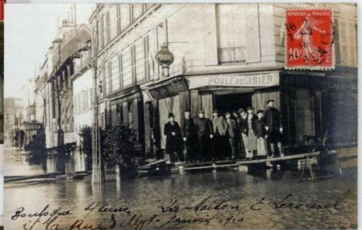
17 Carte sur la Maison E. Lerouxel, Bar – tabac – restaurant, située à l'angle de la rue de Silly et de la rue Michelet. Aujourd'hui, c'est toujours un restaurant, « Le Michelet ».