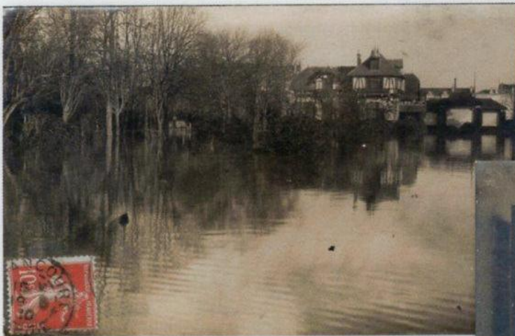
14 Cette propriété appartenait à Adolphe de Rothschild, directeur de la Banque de Naples. Son parc est devenu le Parc des Sports municipal, à côté du Groupe scolaire édifié en 1933. Photographe non-identifié. L'expéditeur témoigne « Je vous envoie un coin de la propriété. Vous pouvez juger comme nous avons été inondés ». Au verso, un commentaire : « Propriété Rothschild - Rue de Sèvres - Boulogne sur Seine pendant les inondations. 22 janvier 1910 »