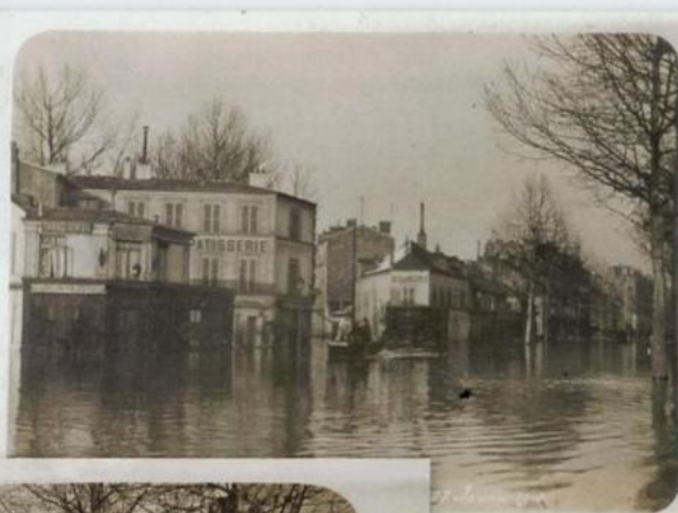
22 Photographie non-identifiée. Carte légendée « L'inondation à Boulogne sur Seine. 27 janvier 1910 ». La Grande Rue.

23 Photographe Maurice Philippe. Photo 1638 – 250 rue Étienne-Marcel – Bagnolet (près Paris).