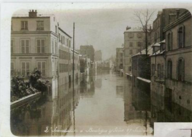
21 Photographie non-identifiée. Rue du Port.