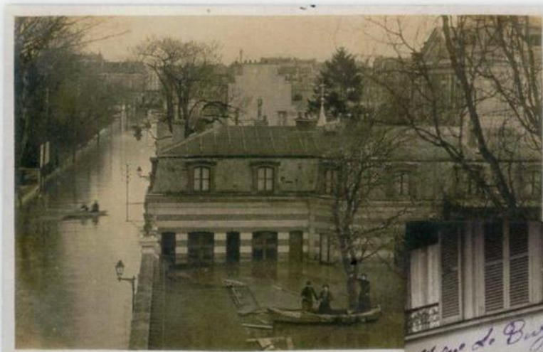
24 Photographie non-identifiée. Carte légendée « 11 rue de Buzenval ». Au verso, un commentaire : « J'espère que vous avez été indemne (sic !) et que vous êtes en bonne santé tous les deux. Nous étions un peu plus parmi les inondées (sic !). On allait en bateau à deux pas de chez nous. Notre cave est pleine d'eau jusq'en haut. Vous pouvez me croire que c'est épouvantable de voir arriver l'eau sur soi pareillement ? Enfin Dieu nous a protégée (sic !). Aussi nous le remercions de tout cœur ».