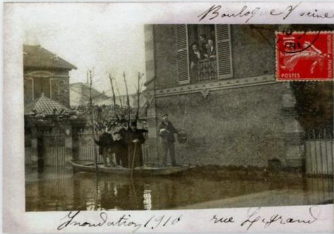
16 Carte légendée « Inondation 1910. Rue Legrand. Boulogne sur Seine ».