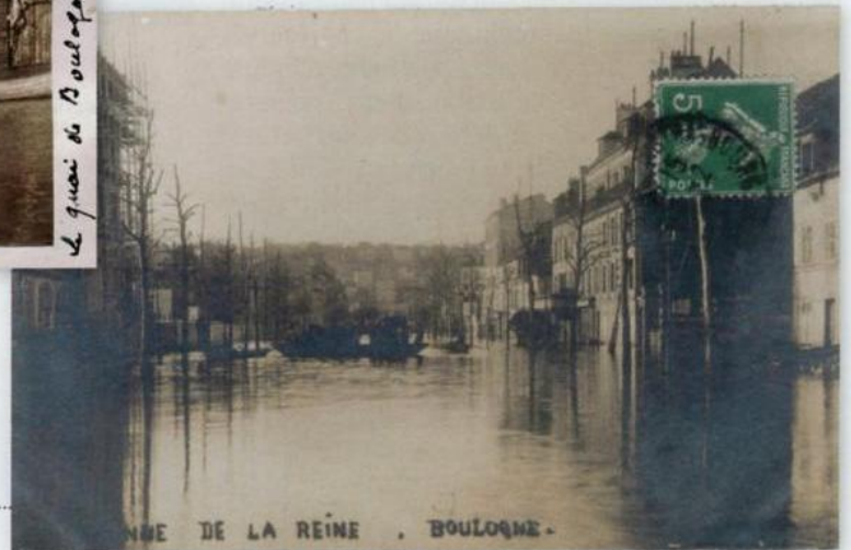
19 La route de la Reine.

de la Reine. En 1916, la rue de la Plaine 15 a pris le nom du général Gallieni, gouverneur de Paris en 1914, qui a sauvé la capitale et Boulogne en stoppant l'offensive allemande.