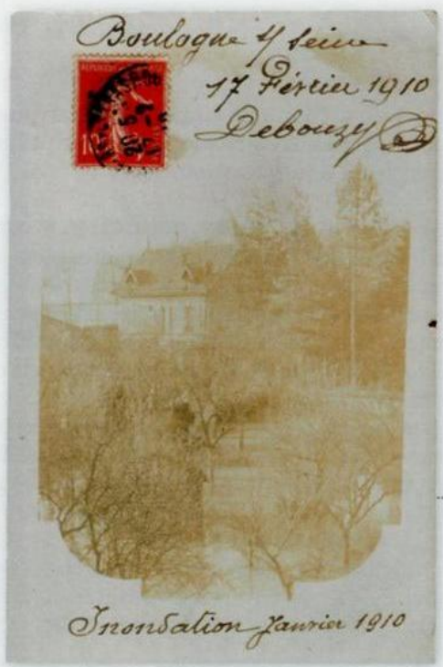
27 Photographie non-identifiée. Tirage sur papier photographique J. Jouglu. Au verso, un commentaire : « Souvenirs d'une mauvaise semaine. » Quai du 4 Septembre.